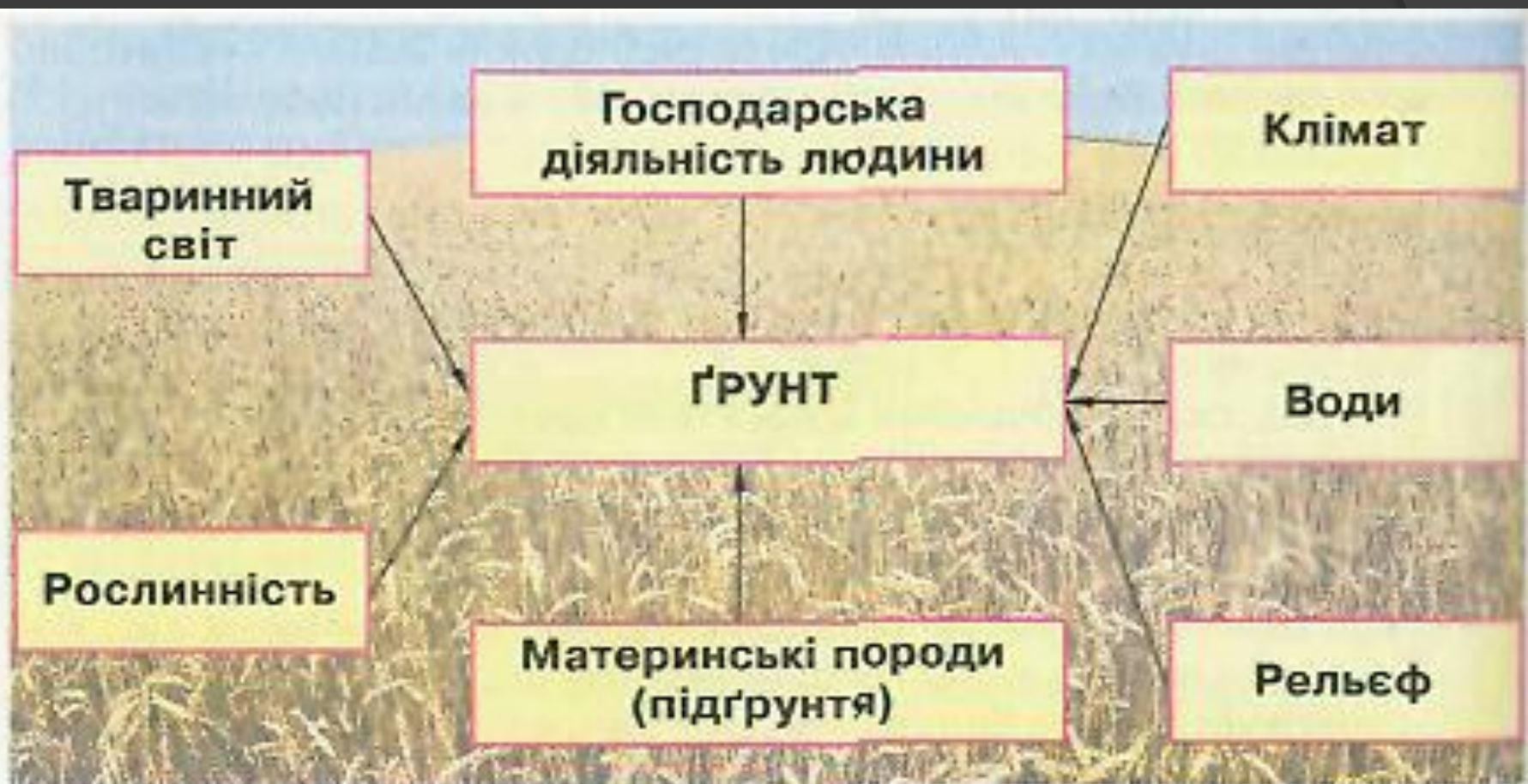
Мал. 104. Ґрунотвірні чинники